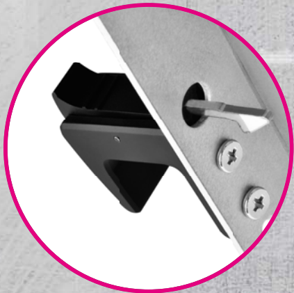
Rackmountキャビネットへの自動ロック