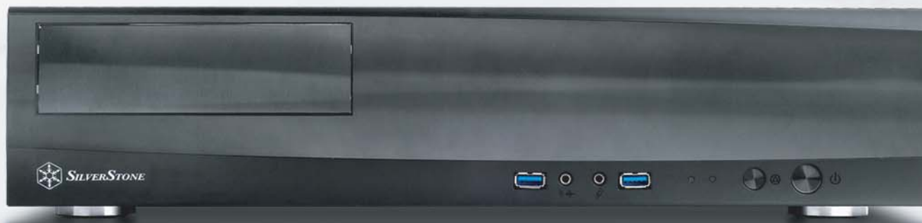
Milo Series ML03