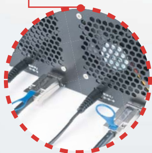
Mini-SAS-SFF-8088 und Netzteil an externen Speicher anschließen