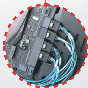
CPS03-RE an SATA-Ports des Motherboards anschließen