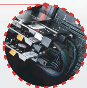
Interne Kabel von Mini-SAS-Adapter und Netzteil anschließen