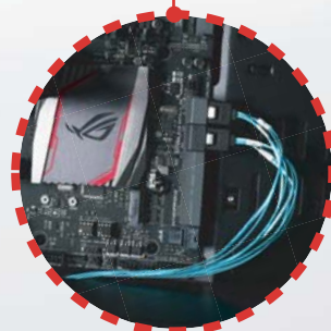
CPS03-RE an SATA-Ports des Motherboards anschließen