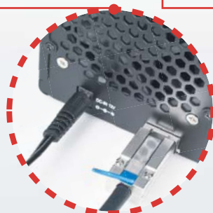
Externe Kabel von Mini-SAS-Adapter und Netzteil anschließen