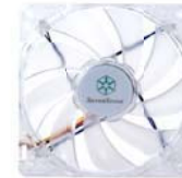
FN121-BL 120 mm-Lüfter mit blauen LEDs; unveränderbare Geschwindigkeit von 1200 rpm.