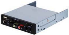
FP35 Erstklassiger 3.5" Kartenleser kombiniert mit allen Ein- und Ausgängen.