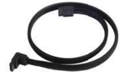
CP08 Qualitativ hochwertiges SATA-III-Kabel mit Anti-Kratz-Verriegelung und 90°-Anschluss.