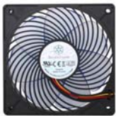
AP121 Ein bahnbrechender Computerlüfter mit Luftkanalisierungstechnologie.