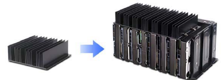
Integrierter und innovativer Festplattenkühler

*2- Wenn eine Festplatte vor den Karten installiert wird, beträgt die maximale Länge 32,512 cm (12,8 Zoll).