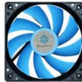
Suscool 121 Statten Sie Ihren TJ04-E zur ultimativen Kombination aus Geräuscharmheit und Leistung mit Suscool 21 aus.