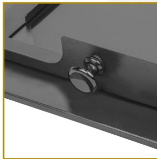
Reemplazo directo, sin herramientas y sin tornillos