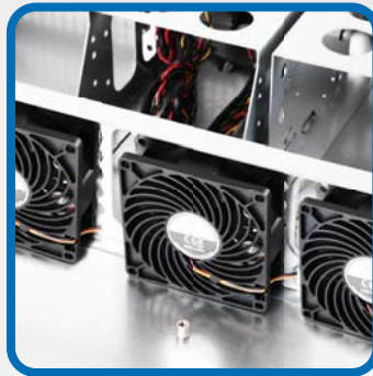
พัดลมขนาด ไม่มีมาให้