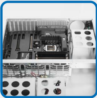
สนับสนุนเมนบอร์ด ATX

รองรับการใส่รางเสียบแบบติดตั้งเร็ว (Quick rail slide) สำหรับตู้แร็ค (ชุดรางขายแยก)