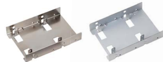
SDP08 / SDP08-LITE 3.5” - 2.5” ベイコンバーター。