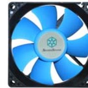
SST-SUSCOOL81 静音とパフォーマンスの究極の組み合わせにはPS09にSuscoo81の装備を。