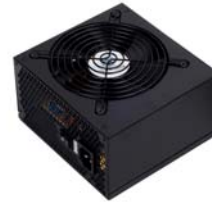
ST40F-ES 手頃な高性能400W PSU