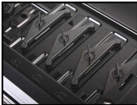
免工具安装硬盘位