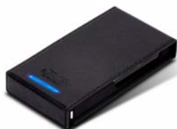
RVS01 eSATA接口最大传输速度 可达3Gbits, USB2.0 接口 最大传输速度可达480Mbits