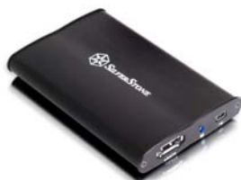
TS02 eSATA与USB接口的2.5吋硬盘外接盒