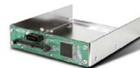
HDDBOOST 减少资料写入次数，以大幅 增加固态硬盘的使用寿命