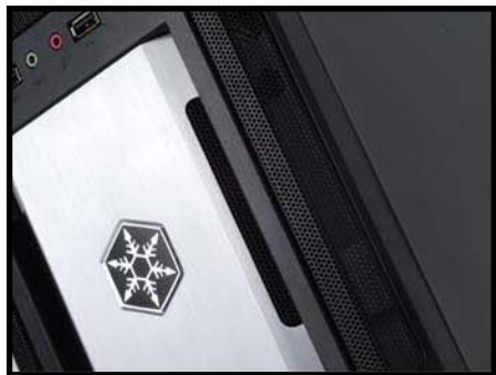
经典的前面板设计