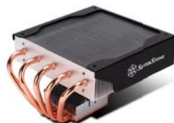
NT06-E 高效能处理器散热装置