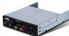
FP35 3.5吋卡片阅读机与 前置I/O整合装置