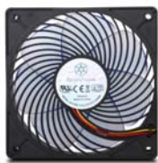
AP121 宽大而重迭的叶片， 对抗风阻能力更强