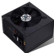
ST40F-ES/ST50F-ES 高效率表现的80 PLUS认证，单路12V 稳定供电，400W(500W)足瓦输出