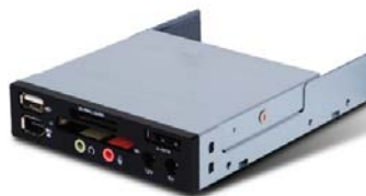
FP35 3.5吋卡片阅读机与前置I/O整合装置