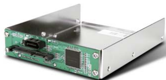
HDDBOOST 减少资料写入次数，以大幅增加固态硬盘的使用寿命