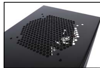
可选购1颗14公分。 (或12公分风扇)