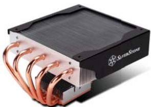
NT06-E 高效能处理器散热装置