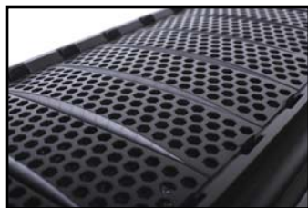
引领时尚的前面板设计。