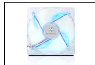
12公分冷光进风风扇。