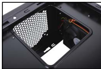
CPU区块后方预留窗孔以方便 安装散热器。