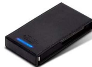
RVS01 eSATA接口最大传输速度可达3Gbits USB2.0 接口最大传输速度可达480Mbits