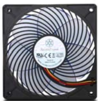
AP121 宽大而重迭的叶片， 对抗风阻能力更强。