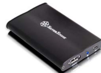
TS02 eSATA与USB接口的2.5吋硬盘外接盒