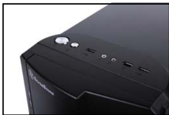
USB2.0 x 2, IEEE1394 x 1, Audio x 1, MIC x 1。