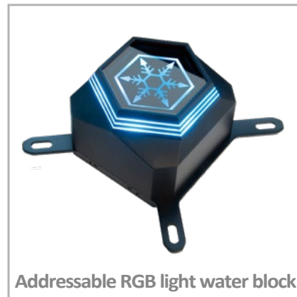
Addressable RGB light water block