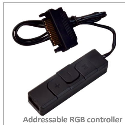
Addressable RGB controller