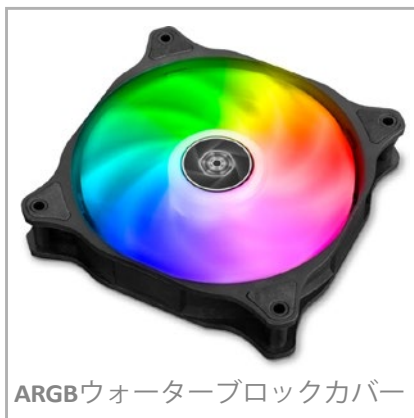
ARGBウォーターブロックカバー