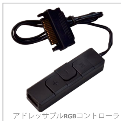
アドレスサブルRGBコントローラ