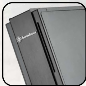
オーソドックスな SilverStoneスタイル