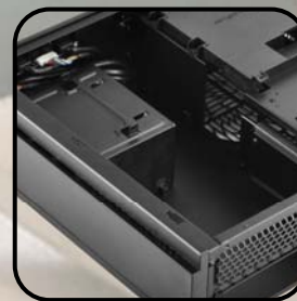
Mini-ITXマザーボードおよびSFX PSU互換