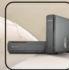
横置きと縦置き可能 でほぼいかなる環境 にも適合