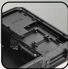
最大13インチのグラフィックスカードをサポート