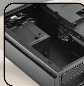
Compatible con placas base Mini-ITX y FA SFX