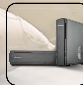
Encaja en casi cualquier lugar con su orientación horizontal o vertical