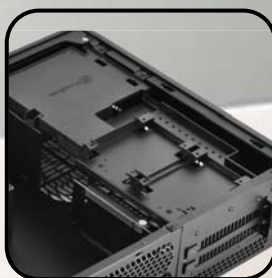
Acepta tarjetas gráficas de hasta 13 pulgadas