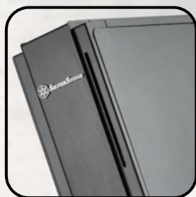
Clásico diseño SilverStone