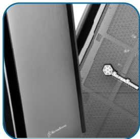
两种不同的银欣风格前面板设计，大风流(KL05B-W)或极静音(KL05B-Q)