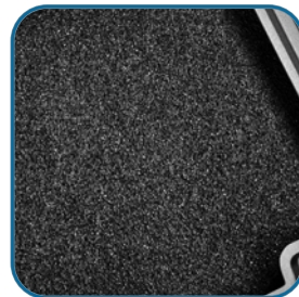
侧边进风及侧板静音棉设计，有效降低体感噪音(KL05B-Q)