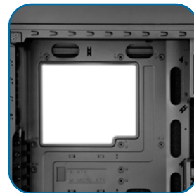
背板镂空设计，方便换装CPU散热器