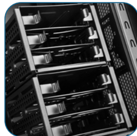
6组可自由选择容纳2.5吋或3.5吋的硬盘架