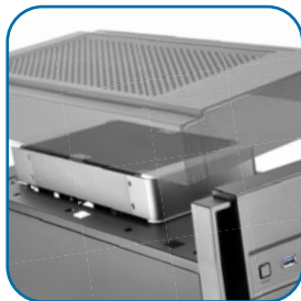
上方及前板无障碍安装240mm或280mm水冷排设计