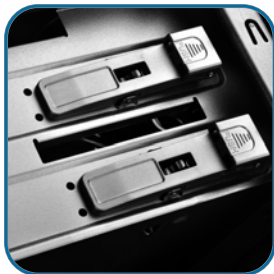
2组5.25吋磁盘架(免螺丝扣具设计)