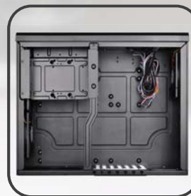
ATXマザーボード対応