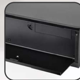
ロック可能なフロントドアにより、システムとドライブの安全を確保