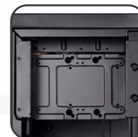
多目的マウント付属のドライブケージで、アダプタは不要