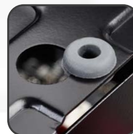
防振構造によるノイズ抑制