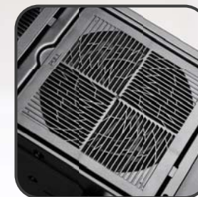
アクセス容易なフィルタでホコリ蓄積を防止