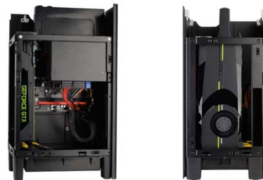
FT03-MINI support with 10" long NVIDIA GeForce GTX 680

AMD Radeon HD 7770, NVIDIA GeForce GTX 560 Ti, 560, 550 Ti, 460 – 8.25"