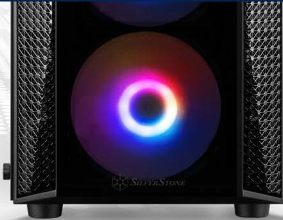
4 x 120-mm-ARGB-Lüftern und ARGB Controller