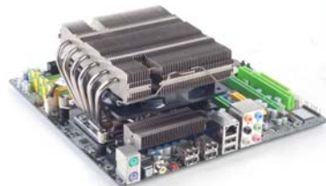
NT06-PRO Le dissipateur ultime pour quasiment tous les systèmes.