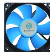
SST-SUSCOOL81 Equipez votre boîtier PS09 avec un ventilateur Suscool 81 pour obtenir l'ultime combinaison du silence absolu avec d'excellentes performances.