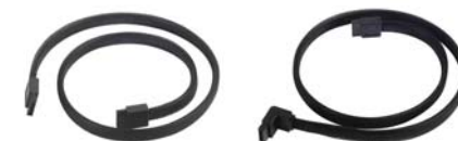
CP07+CP08 Les câbles SATA III CP07+CP08 sont parfaits pour tous les appareils SATA standards.