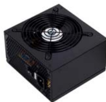
ST40F-ES Alimentation de 400W de qualité abordable.